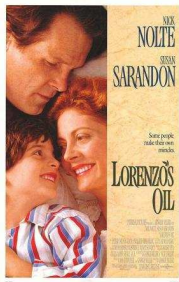
EL ACEITE DE LA VIDA.