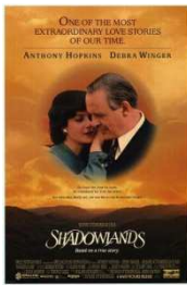
TIERRAS DE PENUMBRA.