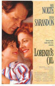
EL ACEITE DE LA VIDA.