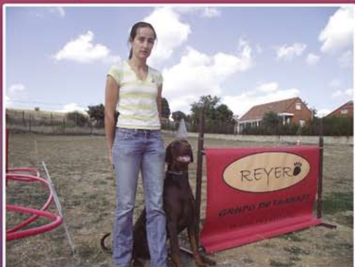
EL AMIGO FIEL